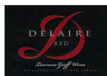
Delaire RED 82% Cabernet Sauvignon 8% Cabernet Franc 6% Petit Verdot 3% Malbec 1% Merlot