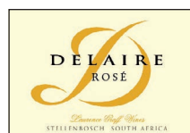
Rosé 100% Cabernet Franc