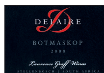
Botmaskop 63% Cabernet Sauvignon 13% Cabernet Franc 12% Merlot 10% Petit Verdot 2% Malbec