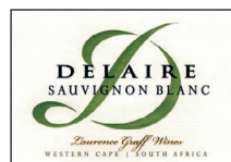
Sauvignon Blanc 100% Sauvignon Blanc