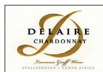
Chardonnay Banghoek Reserve 100% Chardonnay

Für weitere Informationen und Unterlagen sehen Sie bitte unter www.right-to-hear-foundation.ch oder wenden Sie sich direkt an contact@right-to-hear-foundation.ch .