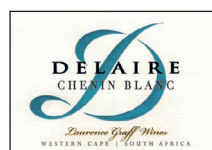
Chenin blanc 100% Chenin Blanc