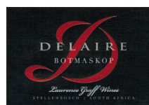
Botmaskop 69 % Cabernet Sauvignon 13 % Cabernet Franc 6 % Merlot 9 % Petit Verdot 3 % Malbec